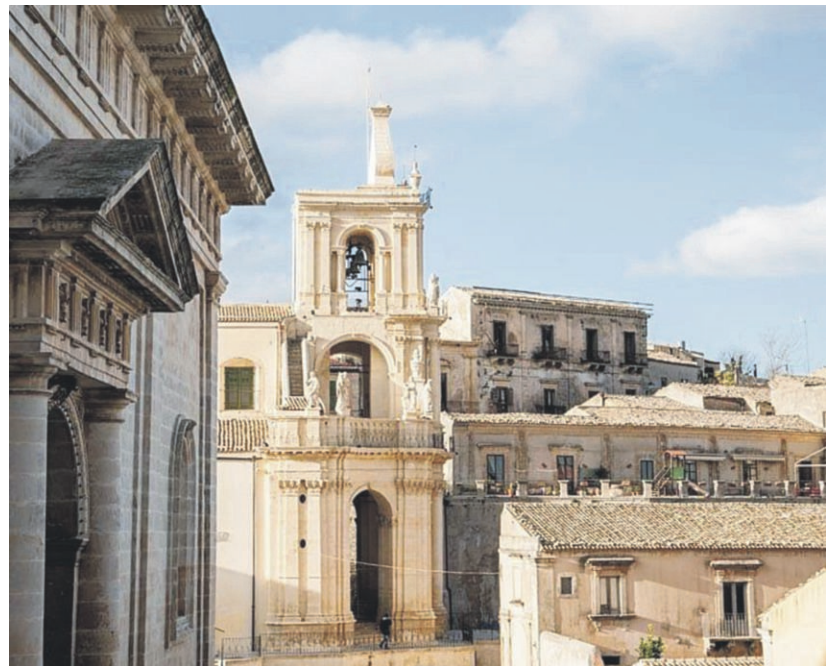
Il suggestivo centro storico di Palazzolo Acreide